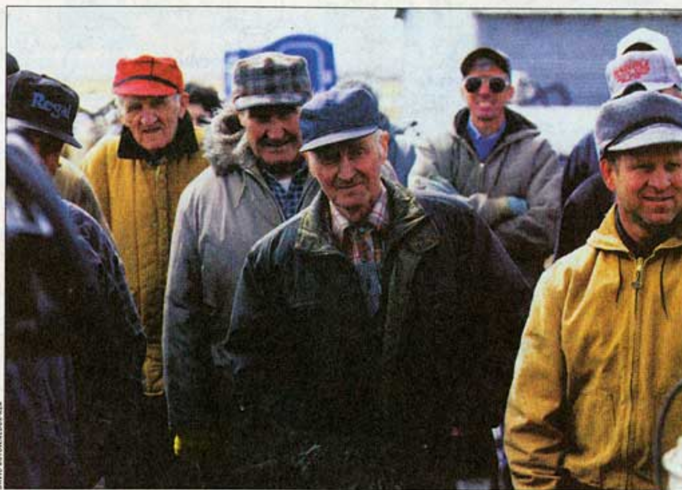
Parmi ces travailleurs qui tentent leur chance à l'embauche, certains ont largement dépassé l'âge de la retraite. Ici, dans le nord du Dakota, en 2001, où la forte baisse des emplois agricoles a dépeuplé la région.

précarisé. Ce qui est généralement qualifié de « carrière » n'est, le plus souvent, qu'une succession d'emplois, en principe dans un même secteur d'activité, qui s'enchaînent avec une relative régularité. Le travailleur américain type change d'employeur tous les quatre ans en moyenne. C'est donc dire que la notion même d'emploi « stable », d'emploi de carrière, d'emploi « protégé » correspond aux Etats-Unis à une réalité tout autre que celle évoquée par ces termes en France ou dans la plupart des pays européens.